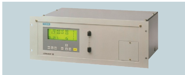
Abb. 3: ULTRAMAT 23

Die Informationen in dieser Case Study enthalten Beschreibungen bzw. Leistungsmerkmale, welche im konkreten Anwendungsfall nicht immer in der beschriebenen Form zutreffen bzw. welche sich durch Weiterentwicklung der Produkte ändern können. Die gewünschten Leistungsmerkmale sind nur dann verbindlich, wenn sie bei Vertragsabschluss ausdrücklich vereinbart werden. Liefermöglichkeiten und technische Änderungen vorbehalten.